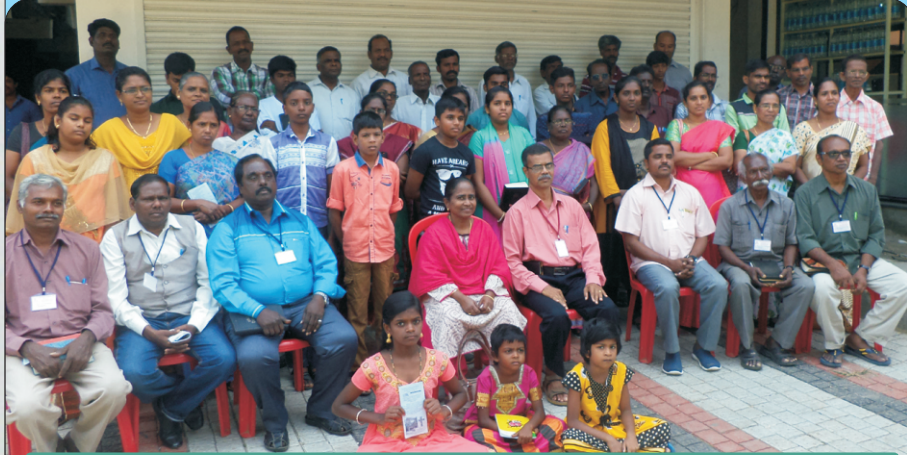
குமுளியில் 8வது வேர்ல்டு இவான்சலிசம் ரிடரீட்

Cell : 94435 58041 Phone : 04543 263 278 E-Mail arjunanglory@gmail.com