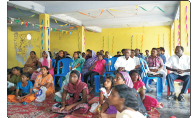
12-வது ஆண்டு விழாவில் கலந்துகொண்ட சகோதர சகோதரிகள்