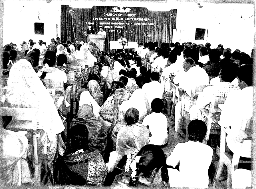
வேதாகம கருத்தரங்கில் திரண்டு இருந்தவர்கள்