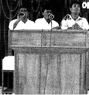
கருத்தரங்கில் பாடல் குழுவினர்