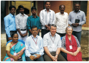
World Evangelism Bible School First Batch 2014 -2016

R.N.I.No.TNTAM/2000/3629 Postal Registration No.DDL/19/2015-2017 Posted at Batlagundu Post office on 10th Nov. 2016