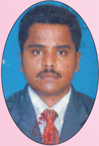
Associate Editor: S.Reagan