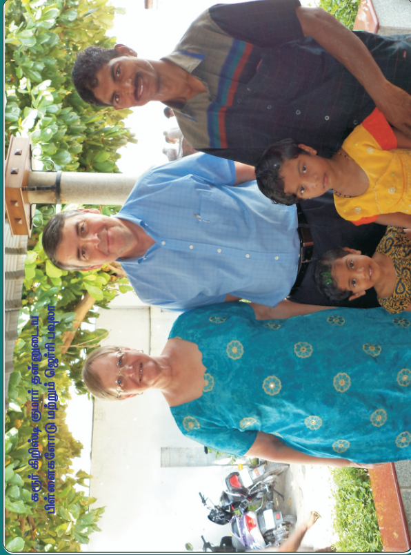
சுதர் கிறிஸ்து சமூகர் தானுடைய பிள்ளைகளை மறைய் சென்றி.புது

நல்ல விதை ராஜ்யத்தின் புத்திரர் களைகள் பொல்லாங்கனுடைய புத்திரர் - மத்தேயு 13:12