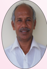
Associate Editor: A.Kanagaraj