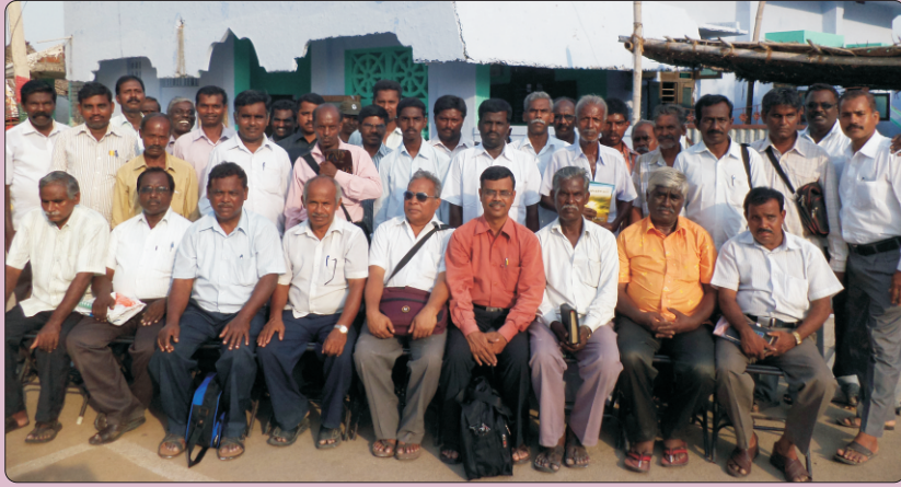
Tamil Nadu Church of Christ Preacher's Seminar at Pandamangalam Namakkal DT 2nd October 2014