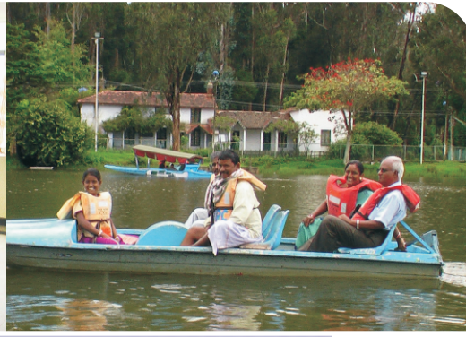
BOATING AT KODAIKANAL LAKE