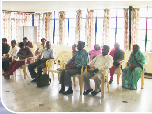
PREACHERS' MEETING AT KODAIKANAL

R.N.I.No.TNTAM/2000/3629 Postal Registration No.DDL/19/2009-2011 Posted at Batlagundu Post Office on 10th Mar. 2011