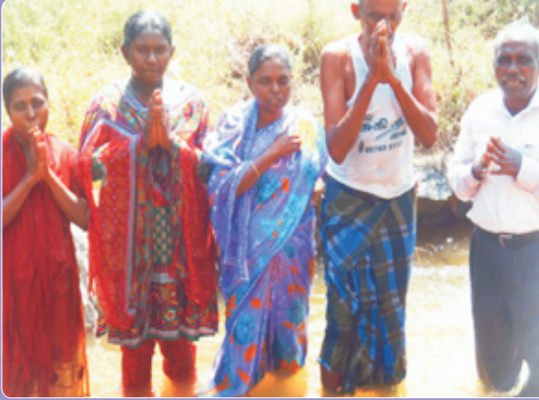
தேவனுடைய ராஜ்யத்தில் புதிதாயி பிறந்தவர்கள்