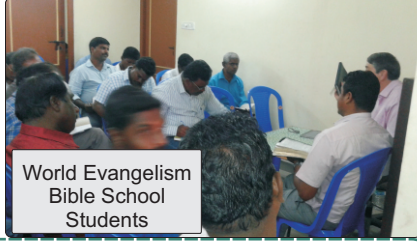
World Evangelism Bible School Students