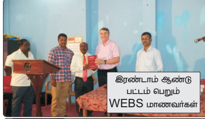
இரண்டாம் ஆண்டு பட்டம் பெறும் WEBS மாணவர்கள்