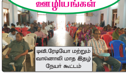
டிவி. ரேடியோ மற்றும் வானொலி மாத இதழ் நேயர் கூட்டம்