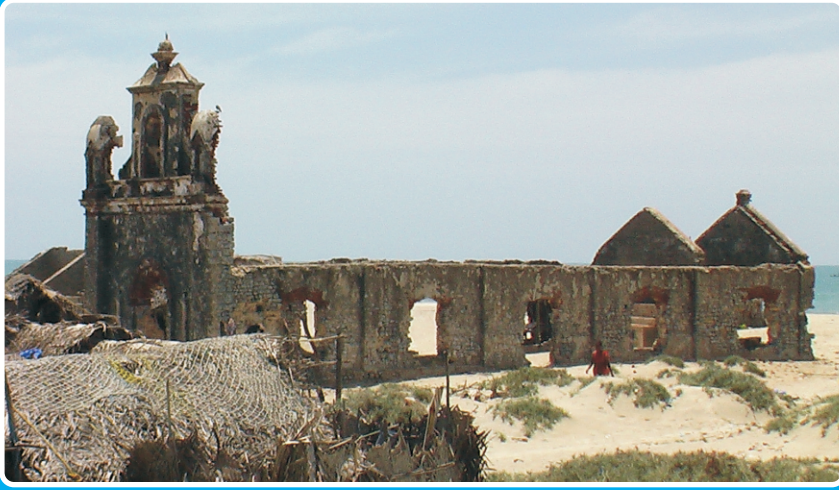
1964-ல் சுனாமியால் தூக்கப்பட்ட தனுஷ்கோழ ஆலயம்

Our Radio & TV Programs Sri Lanka Radio SW 25,41 Meter on Saturday 5.30P.M & Nambikkai TV on Monday & Saturday 7.30 P.M