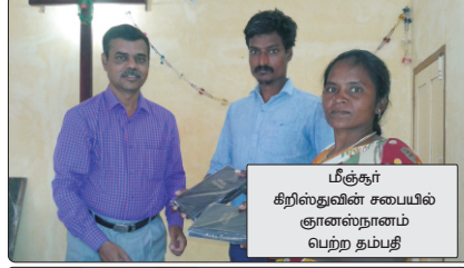
பிஞ்சு கிறிஸ்துவின் சபையில் ஞானஸ்நானம் பெற்ற தம்பதி