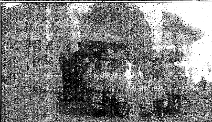
பதினான்காவது ஊரசுகர் கருத்தரங்கில் கவந்து கொண்ட பிதவனுங்கள்

வாசகர்கள் எங்களோடு கடித தொடர்பு கொள்ளும்போதும், மனியாடர் அனுப்பும்போதும் தயவுசெய்து உங்களுடைய Ref.No. யை மறக்காமல் எழுதவும்