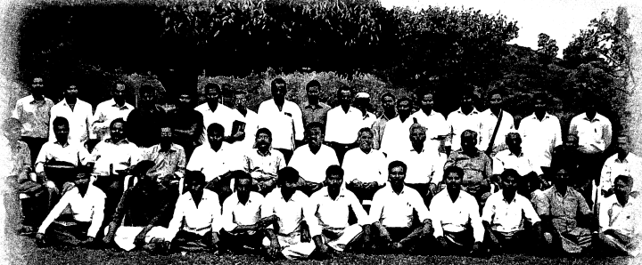
முகாமில் கலந்து கொண்ட தேவ ஊழியர்கள்...