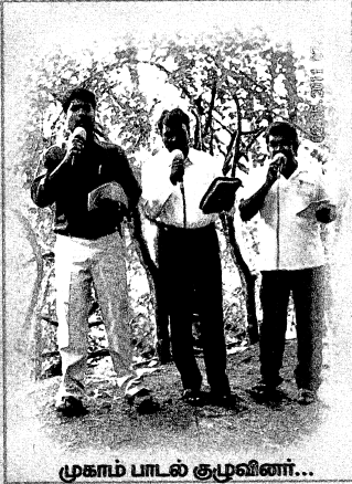
முகாம் பாடல் குழுவினர்...