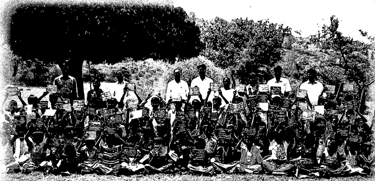
சிறுவர், சிறுமியர்கள் பரிசு வசன அட்டைகளுடன்...