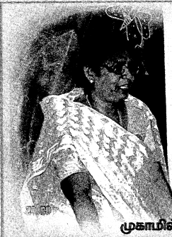
முகாமில் பெண்களுக்கான சிறப்பு வகுப்பின் போது...