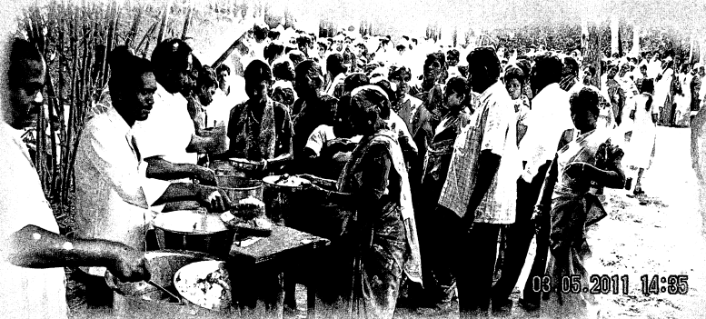
முகாமில் உணவு வேளையின் போது...