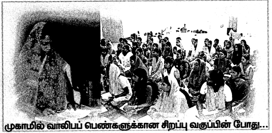
முகாமில் வாலிபப் பெண்களுக்கான சிறப்பு வகுப்பின் போது...