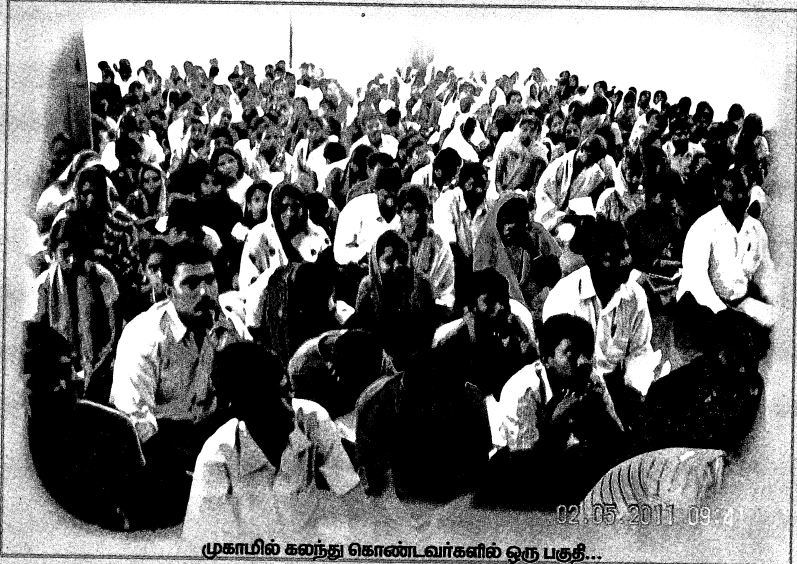
முகாமில் கலந்து கொண்டவர்களில் ஒரு பகுதி...