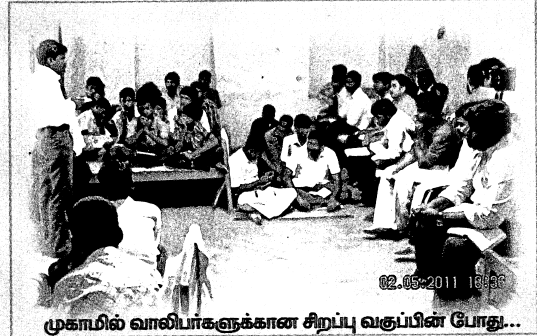
முகாமில் வாலிபர்களுக்கான சிறப்பு வகுப்பின் போது...