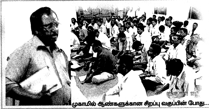
முகாமில் ஆண்களுக்கான சிறப்பு வகுப்பின் போது...