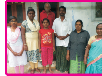
கேரளா திருச்சி மாவட்டம்