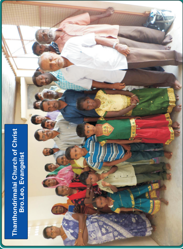
Thanthondrimalai Church of Christ Bro. Leo, Evangelist

கலிலேயராகிய மறுஷூரே, நீங்கள் ஏன் வானத்தை அண்ணாந்துபார்த்து நிற்கிறீர்கள்?...இயேசுவானவர் எப்படி உங்கள் கண்களுக்கு முன்பாக வானத்துக்கு எழுந்தருளிப்போனாரோ, அப்படியே மறுபடியும் வருவார் - அப.1:11