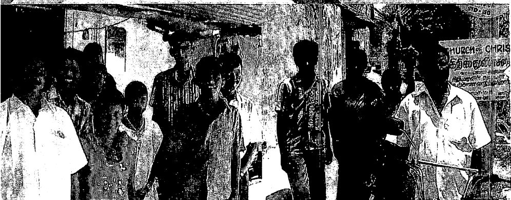
PERUNTHURAL- CHURCH OF CHRIST

R.N.I.No.TNTAM/2000/3629 Postal Registration No.DDL/19/2009-2011 Posted at Batlagundu Post Office on 10th Aug, 2010