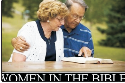
WOMEN IN THE BIBLE

ஒரு புத்தியுள்ள ஸ்திரீ வீட்டைக்கட்டுவாள் என வேதம் கூறுகிறது. குடும்பமாகிய வீட்டு கட்டப்பட வேண்டுமானால் அது ஒரு புத்தியுள்ள ஸ்திரீயினால் மட்டுமே கூடும். அன்பு சகோதரியே, உங்கள் குடும்பம் எப்படியுள்ளது? என்ன வந்தாலும் அசைக்கப்படமுடியாத கன்மலை கிறிஸ்துவின் மேல் கட்டப்பட்ட குடும்பமாக உள்ளதா? அல்லது இடிந்து